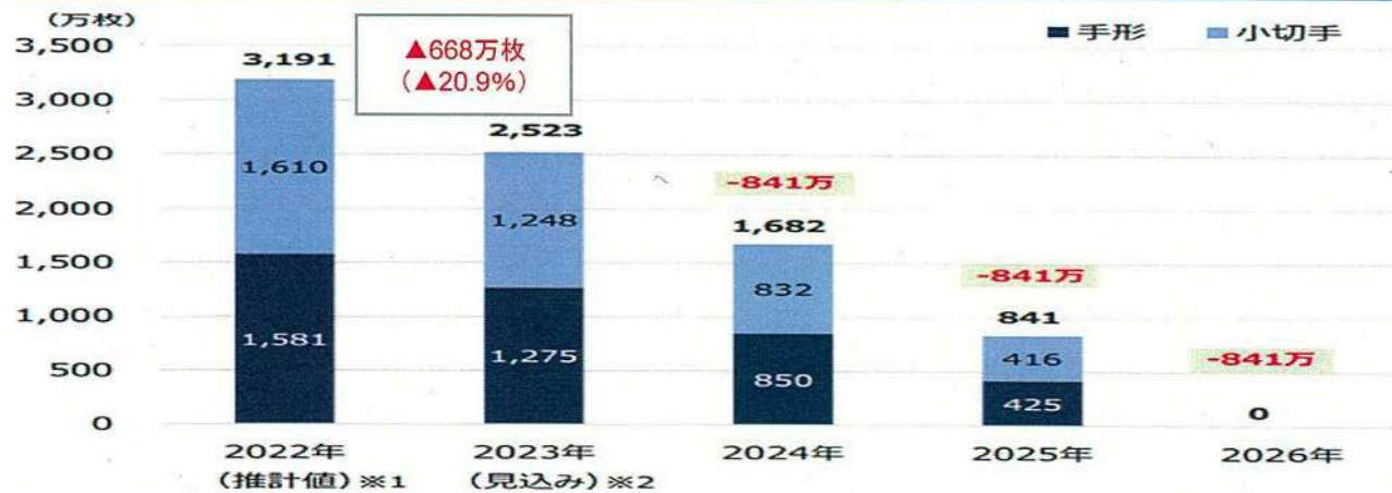
電子交換所における交換枚数の削減イメージ

※1 2022年の全国手形交換所の交換枚数(3,203万枚)、2018年のアンケート[自行交換比率(手形21%、小切手26%)]、電子交換所における2023年1月~9月の手形・小切手の割合(39.0%、37.2%)をもとに推計